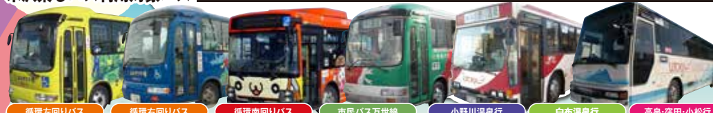
循環左回りバス 循環右回りバス 循環南回りバス 市民バス万世線 小野川温泉行 白布温泉行 高島・窪田・小松行

※一部、乗り放題が適用されない区間がございます。また、区間外には別途料金が発生いたします。予めご確認ください。